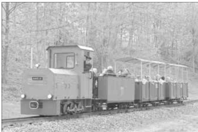
Unsere beliebte Feldbahn

Sächsisches SCHMALSPURBAHN-MUSEUM Rittersgrün e. V. Bernd Kramer, Egon Otto, Ingo Doering