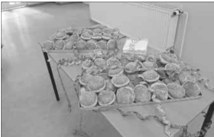
Frische Pfannkuchen von der Bäckerei Loos

Vielen Dank an die Bäckerei Loos aus Antonsthal, die diese so reichlich mit Marmelade gefüllt hatten, dass man es an unseren Gesichtern erkennen konnte.