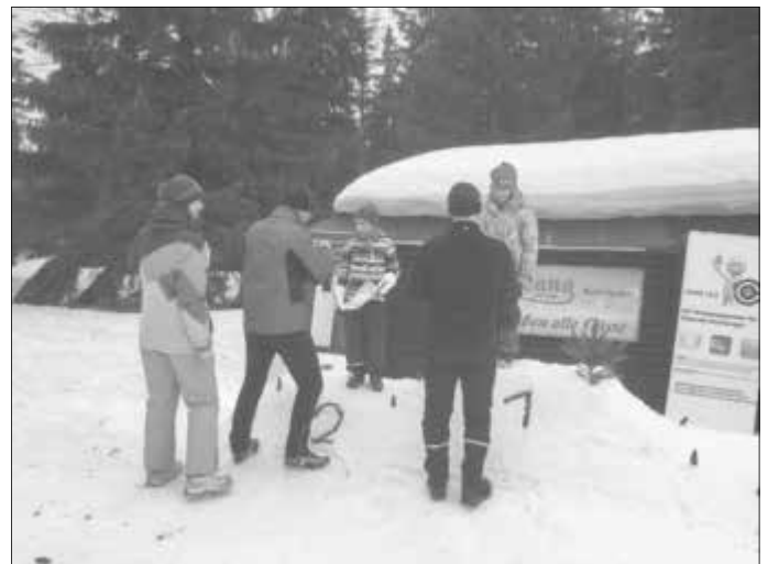
Siegerehrung der Jüngsten durch die Veranstalter und Bürgermeister