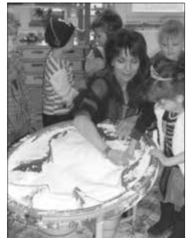
Wird Klara ihren Goldschatz fin- den?