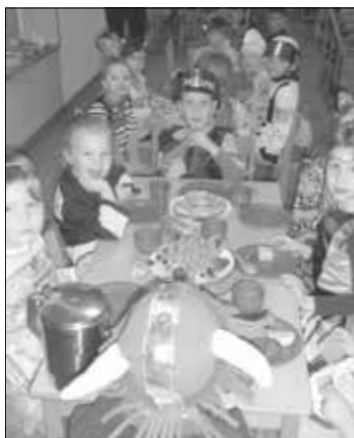
Ein leckeres Frühstück sorgte für einen guten Start in den Tag.

Zu Beginn des Faschings- festes gab es ein großes Frühstück auf dem großen Flur der Kita mit Pfannku- chen und liebevoll gestal- teten Obst - Tieren. Jetzt konnten sich alle Kinder erstmalig gegenseitig be- staunen, was sie für tolle Kostüme trugen. Auch die Erzieherinnen und Prakti- kanten putzten sich heraus. Nach dem Frühstück gab es für die Kinder einen Sta- tionslauf, bei dem jede Gruppe ein anderes Spiel speziell ihres Kontinents vorbereitete. In Afrika übte man Wasser tragen auf dem Kopf, in Australien galt es so schnell wie möglich die Kän- gurubabys zu ihrer Mutter zu bringen. Pferde reiten und Gold suchen konnte man in Amerika und sein Können im Angeln