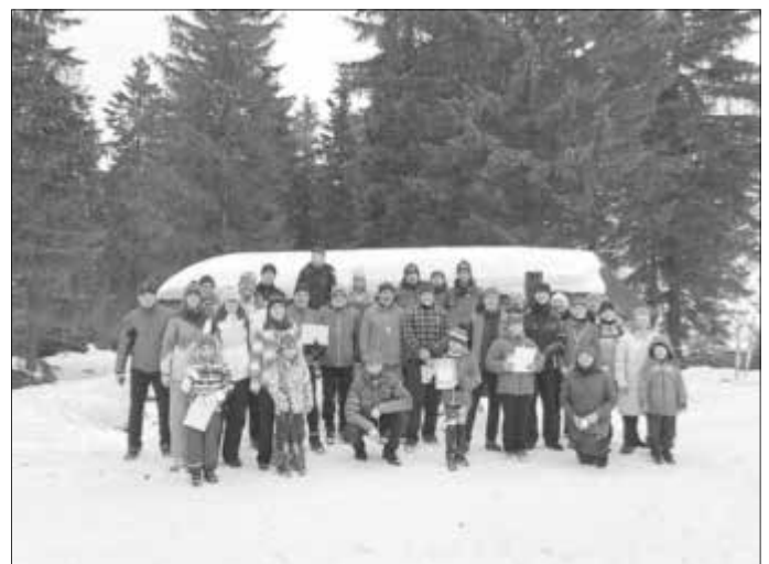
Alle Akteure haben erfolgreich den ersten Wettkampf geschafft!