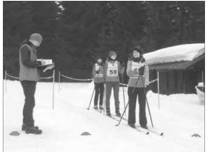
„Die jungen Frauen warten auf den Start“