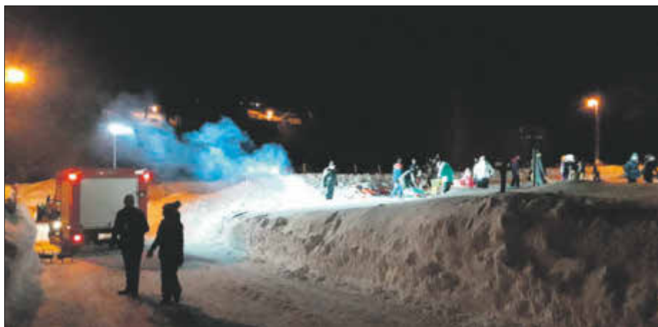
Die Kameraden der FFW Tellerhäuser bei der beleuchtungstechnischen Absicherung des Zugangs