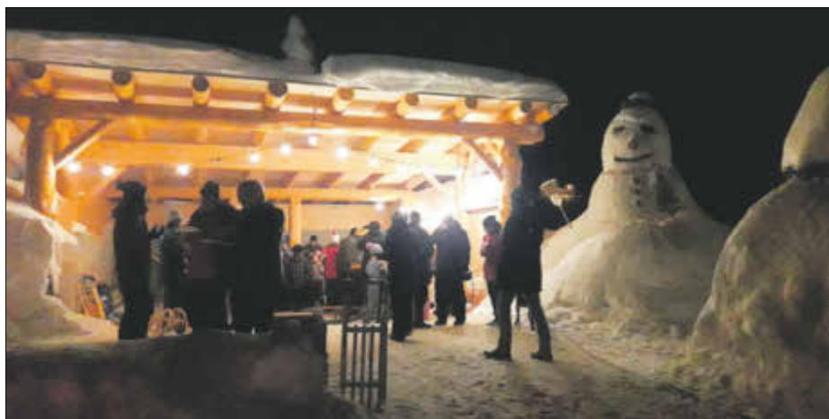
Andrang beim Imbiss unterm neuen Carport mit riesen Schneemann