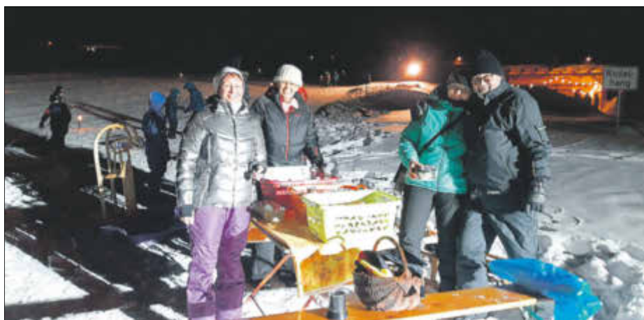
Die Lose-Mädels bei der Arbeit

Am 06.02.2019 und am 20.02.2019 führte der Ortschaftsrat Tellerhäuser die mittlerweile zum festen Bestandteil des „Winterveranstaltungskalenders“ gehörenden „Rodelabende bei Fackelschein“ durch. Das Wetter meinte es an beiden Abenden sehr gut mit uns und so kamen sowohl am 06.02. (Ferien in Berlin und Brandenburg) als auch am 20.02. (Sachsenferien) viele kleine und große Urlauber, aber auch zahlreiche Einheimische zu diesem stimmungsvollen Event.