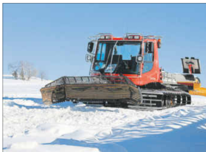
Pistenfahrzeug zur Präparierung der Loipen an der Panoramaloipe

Doch nicht nur in Breitenbrunn sind die Panoramaloipe und der Rodelhang bestens präpariert, auch in Tellerhäuser