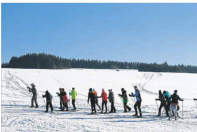
Schüler der Klassen 7 nutzen die optimalen Bedingungen der Panoramaloipe für Wintersporttage.

bereitet das Rodeln Kindern und Erwachsenen größte Freude und die Grenzwiese lädt zum Familienlanglauf ein. Auch hier ein großes Dankeschön an Thomas Kohse, der in Tellerhäuser für beste Bedingungen sorgt.