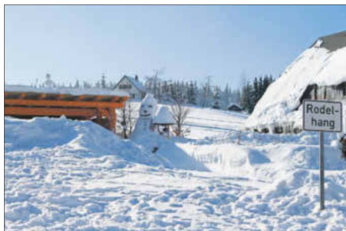
Ein großer Schneemann lädt zum Rodeln am Rodelhang in Tellerhäuser ein.