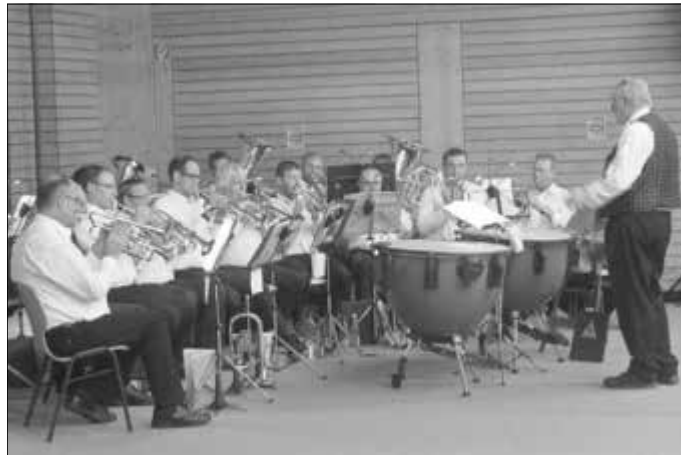
Der Posaunenchor umrahmte den Neujahrsempfang.