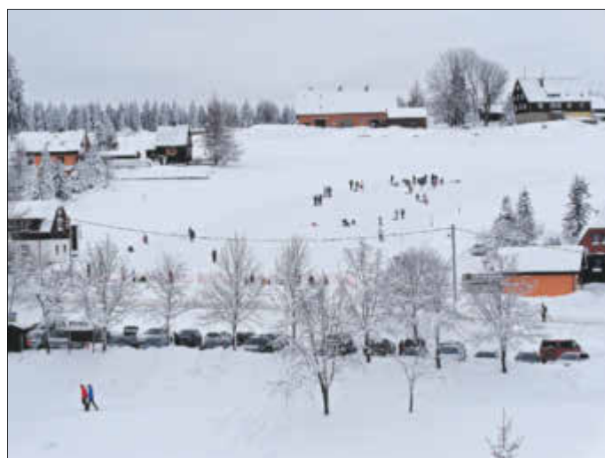
Reges Treiben am Rodelhang in Tellerhäuser