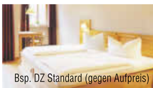
Bsp. DZ Standard (gegen Aufpreis)

TERMINE & PREISE in €/Person im DZ Economy