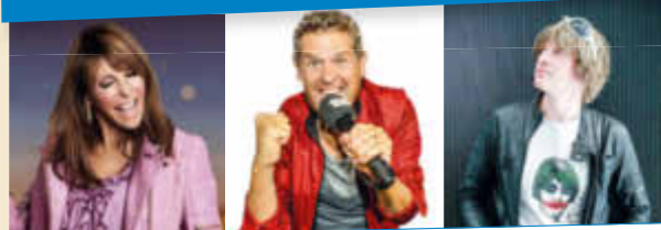
Ireen Sheer, Peter Wackel und Mickie Krause