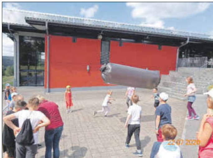
Experiment mit dem Solarzeppelin