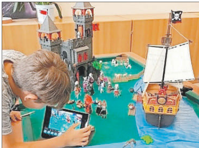
Beim Erstellen des Stop-Motion-Filmes

Digital ging's weiter: Große Ausdauer bewiesen die Kinder beim Erstellen von Stop-Motion-Filmen . In mühevoller Arbeit setzten die Kinder und Jugendlichen bis zu 1.700 Fotos zu einem Trickfilm zusammen. So entstand zum Beispiel eine große Schlacht mit Piratenschiffen und Playmobil-Figuren. Die entstandenen Filme könnt ihr euch auf unser Homepage www.kinderschutzbund-asz.de ansehen!