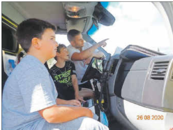
Auf dem Fahrersitz