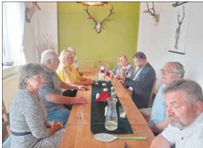
Die deutsch-tschechische Gesprächsrunde in Nova Role (Meziroli)