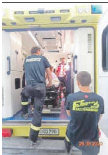
Ein Rettungswagen von innen