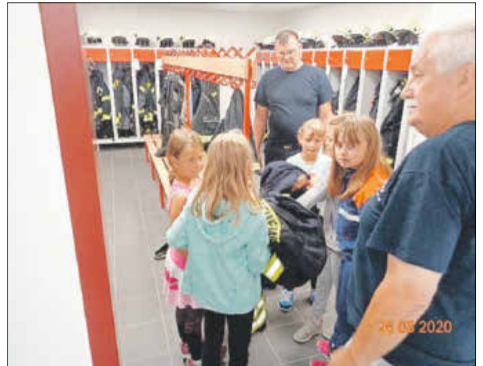
In der Umkleide der Feuerwehrleute