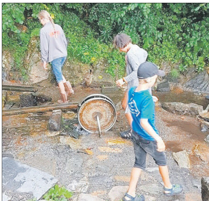
Wandern zum Wasserspielplatz

„Endlich Sommerferien“ hieß es Mitte Juli für alle Schulkinder unserer Gemeinde. Nach dem anstrengenden und außergewöhnlichen Schuljahr konnten Kinder und Jugendliche im Schulclub/ Kinder- und Jugendzentrum des Deutschen Kinderschutzbundes Kreisverband Aue-Schwarzenberg e. V. an der Goethe-Schule Breitenbrunn richtig was erleben. Die Ferien waren gefüllt mit einem bunten Programm, bei dem jeder auf seine Kosten kam. Die Sportbegeisterten konnten beim Klettern auf dem Rabenberg ihren Mut beweisen, beim Tischtennis, Minigolf und Wandern in Aktion treten und sich im Freibad abkühlen. Auch für die kreativen Köpfe wurde wieder einiges geboten: Kerzenziehen, Töpfern im Kinderkunstzentrum und Upcycling mit alten CDs.