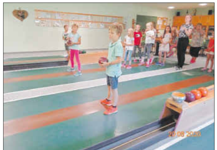
Auf der Breitenbrunner Kegelbahn