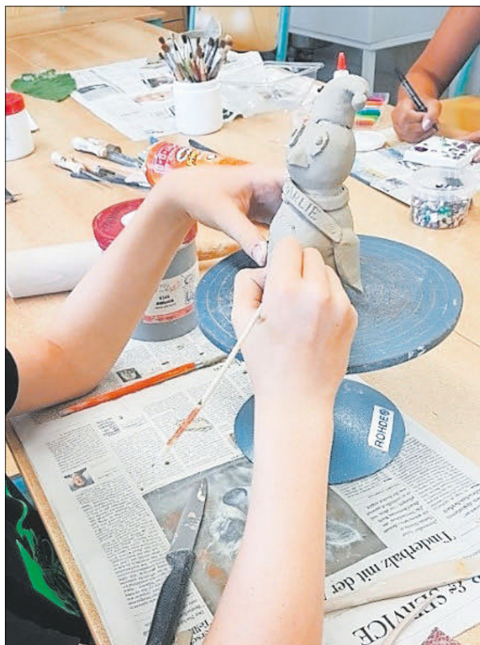
Beim Töpfern im Kinderkunstzentrum

Besonderen Spaß hatten wir beim Spraysen von Bildern und bei der aktuell ganz angesagten Maltechnik Acrylic Pouring . Es hat allen Teilnehmenden viel Spaß gemacht, obwohl eine riesige Kleckerei vorprogrammiert war. Die entstandenen Kunstwerke schmücken nun die Räume des Schulclubs/ Kinder- und Jugendzentrum.