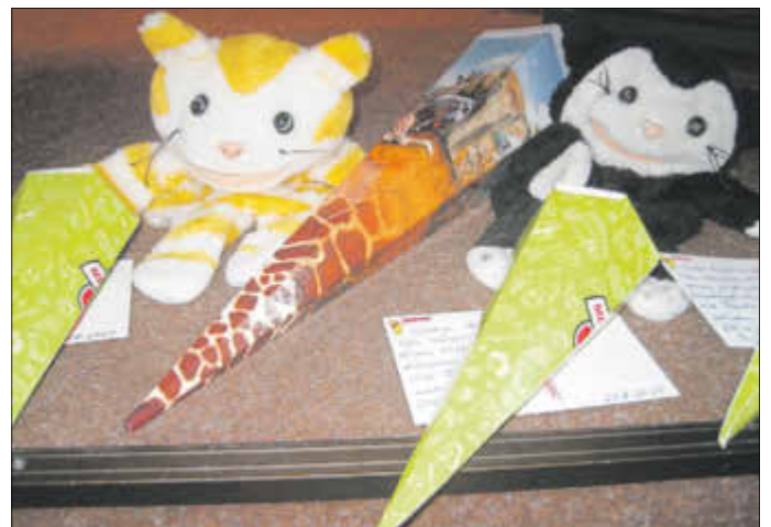
Mimi und Mo feiern mit

Die Lehrerinnen und Lehrer der GS Antonsthal