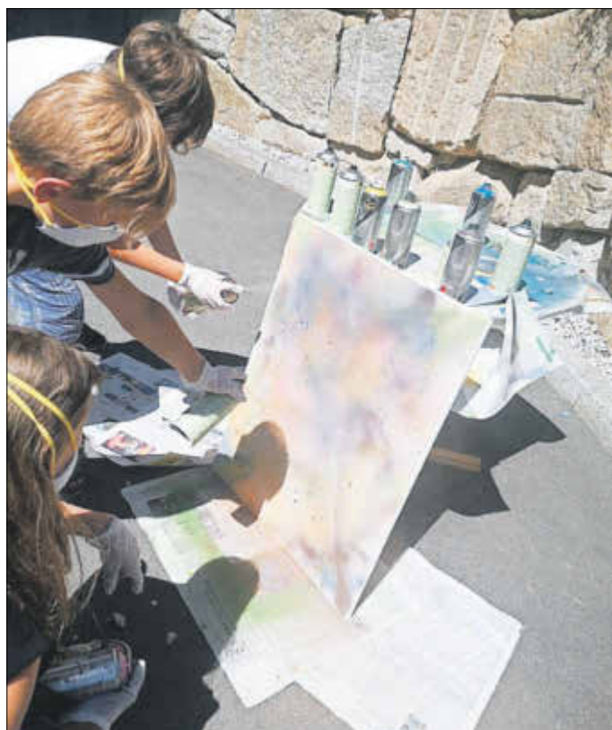
Bilder mit Spray

Besonderen Spaß hatten wir beim Spraysen von Bildern und bei der aktuell ganz angesagten Maltechnik Acrylic Pouring . Es hat allen Teilnehmenden viel Spaß gemacht, obwohl eine riesige Kleckerei vorprogrammiert war. Die entstandenen Kunstwerke schmücken nun die Räume des Schulclubs/ Kinder- und Jugendzentrum.