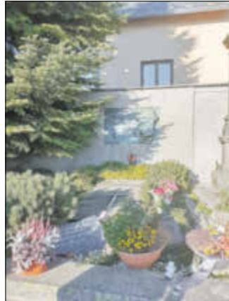
Am Grab des Heimdichters in Gottesgab stellten die Chronisten Blumen ab