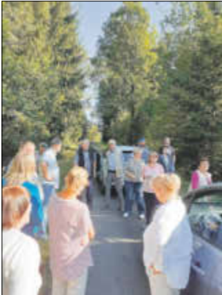
Die Chronisten auf Exkursion im Goldenhöhe

Die Maßnahme wird mitfinanziert durch Steuermittel auf Grundlage des vom Sächsischen Landtag beschlossenen Haushaltes.