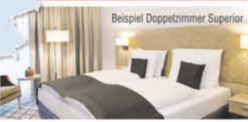
Beispiel Doppelzimmer Superior

Reise-Code: vite schon ab € 119,- p.P. 3 Tage inkl. Halbpension