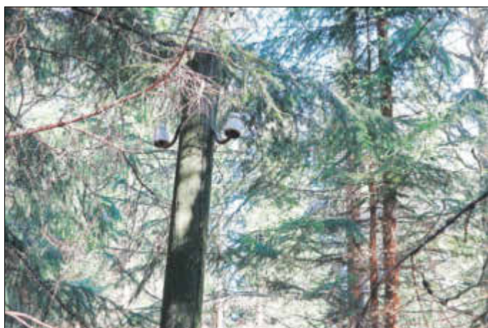
Die Masten mit den Isolatoren für die Meldeleitung haben die Zeit überdauert ...

Die immer wieder gestellte Frage, warum man denn die tschechslowakische Seite zu einem „sozialistischen Bruderland DDR“ eine solche Grenzbewachung aufgestellt hat, lässt sich nicht so einfach beantworten, denn hier spielten offenbar mehrere Aspekte eine Rolle. Einer der wichtigsten davon war auf jeden Fall die Fluchtverhinderung aus Lagern um Joachimsthal, wo ja bis 1961 auch zahlreiche politische Gefangene für den Uranbergbau interniert waren.