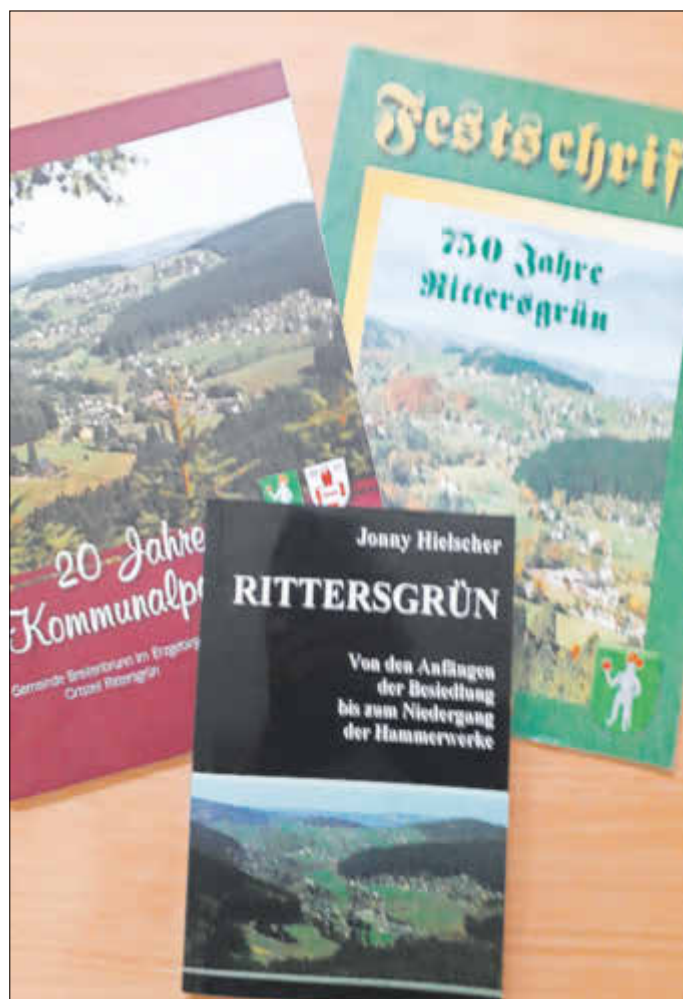
Das Taubenfelsmotiv wurde und wird stets gerne bei Publikationen verwendet