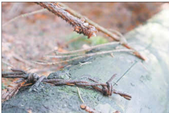
Stacheldrahtreste an Holzpfählen in der Schneise zum Taubenfels

Nachdem der Aussichtspunkt schon vor dem 2. Weltkrieg bekannt und beworben war, gestaltete sich ein Besuch des Taubenfels nach dem Krieg bis in die 60er-Jahre als nahezu unmöglich, denn das Gebiet war als gesichertes Grenzgebiet mit Beobachtungstürmen, Stacheldraht und Meldeleitung Streifengebiet der tschechischen Grenztruppen (Pochranicni Straz), welche hier konkret als „Rota Cesky Mlyn, 3. bPS Karlovarska Brigada (Kompanie Tschechische Mühle der 3. Karlsbader Brigade der Grenztruppen) von 1951 bis ca. 1962/1963 im alten Forsthaus ihren Stützpunkt unterhielten.